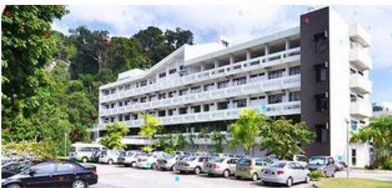
マウントミリアムがんセンター